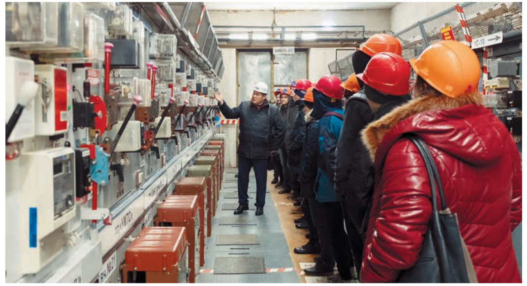
Экскурсия для студентов ЦРП 10 кВ КИТУ

Поскольку моя деятельность является одной из основных в организации, то открываются хорошие перспективы карьерного роста».