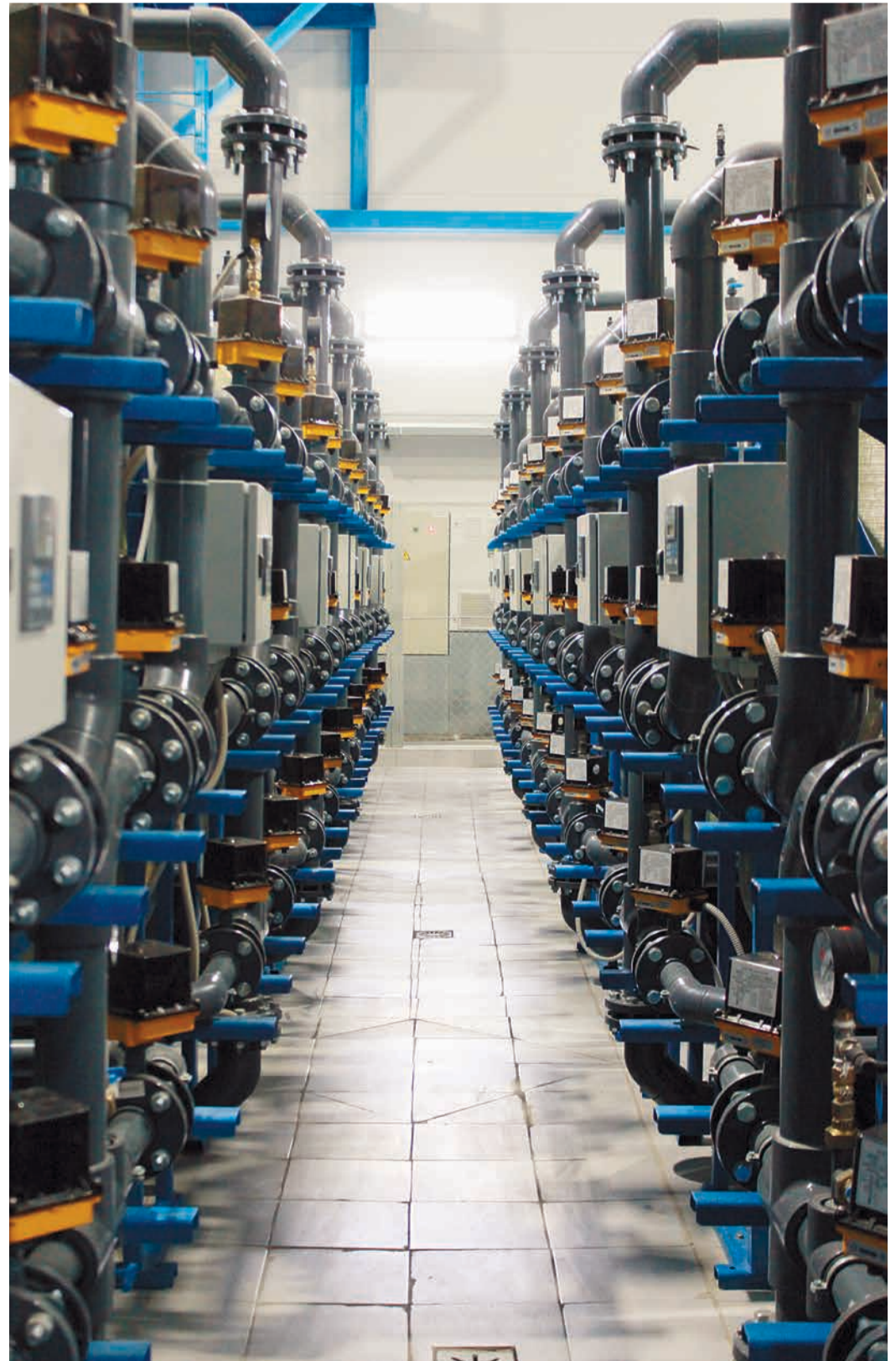
Обвязка фильтров механической очистки ВОС Нюксеница