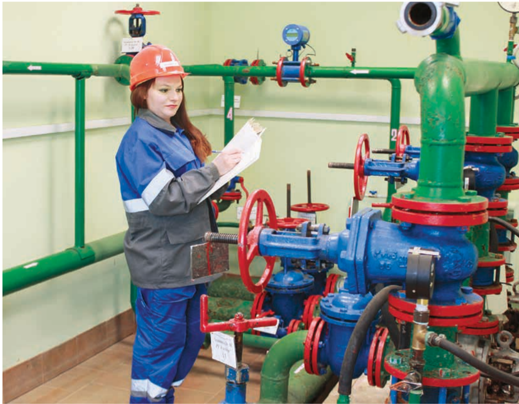
Осмотр насосной станции НХПВ