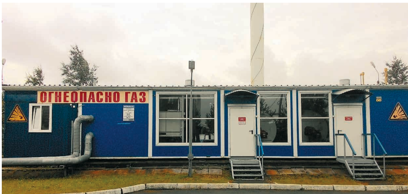
Котельная УМТС Вологда