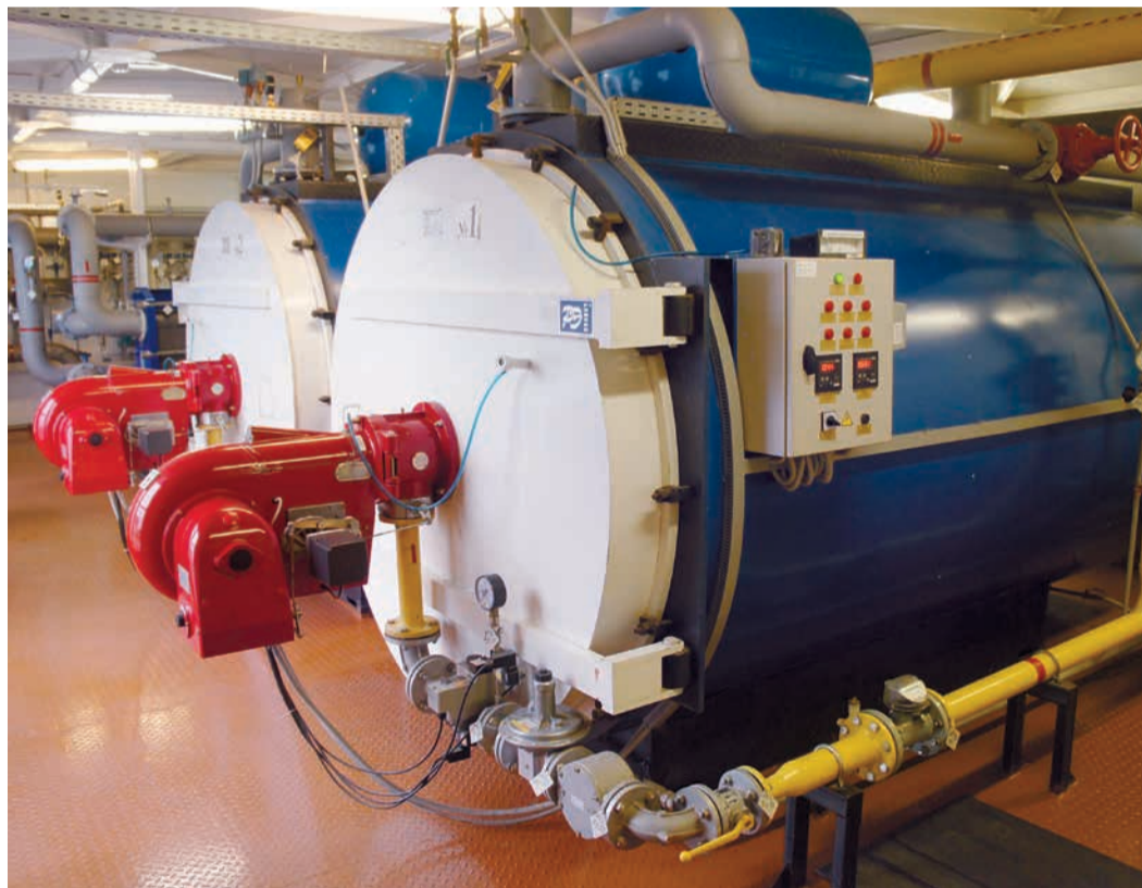
Котельная УМТС Вологда

Информация предоставлена Северным филиалом