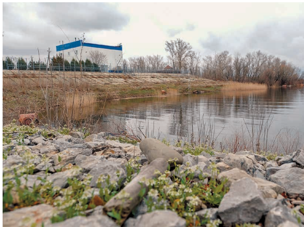
На цветущих астраханских берегах