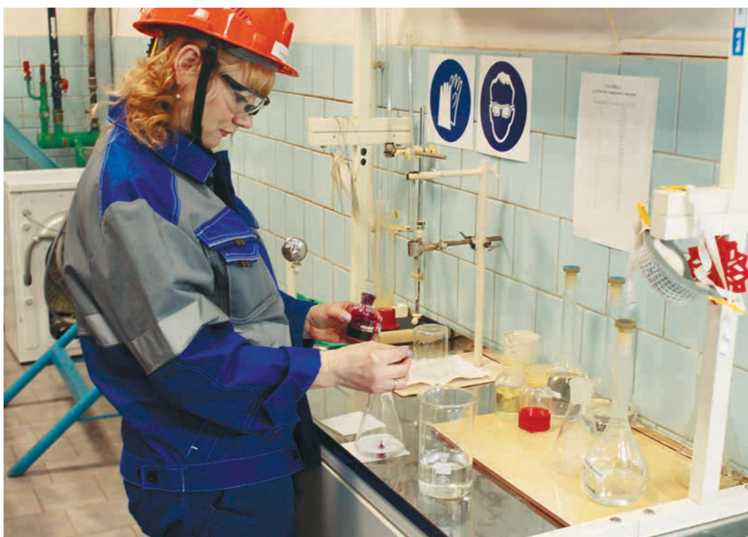
Анализ pH воды в блоке ХВО