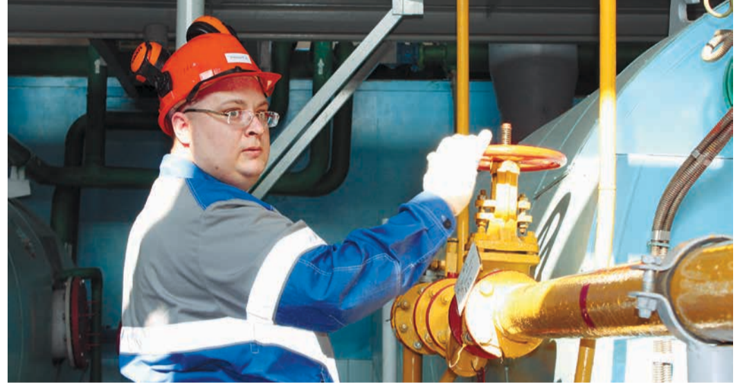
Включение газопровода для запуска котла в работу. Котельная УАВР, Ухта