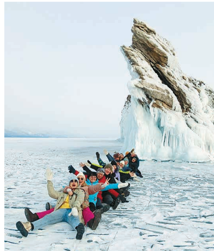
Выходной день на Байкале

Протяжённость территории с севера на юг – 1400 км, с запада на восток – 1500 км. Регион стал домом для многих путешественников, отправившихся на берега Ангары в поисках лучшей жизни, хотя стоит признать, что не все переселенцы направились сюда по своей воле – в Иркутск и окружающие его населенные пункты часто отправляли в ссылку политических заключенных, также внесших свою лепту в этнический состав области. До прихода на территорию Иркутской области русских казаков здесь проживали малочисленные народы и этнические группы – буряты, эвенки и тофалары. ■