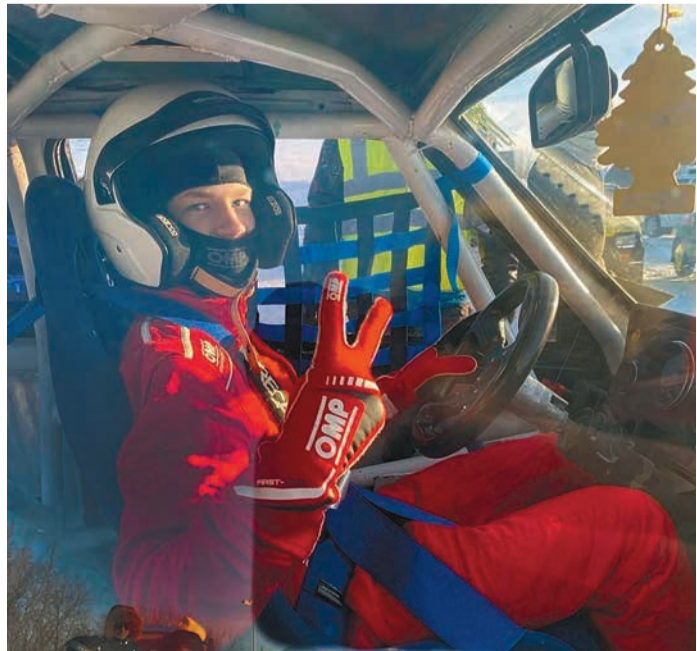
К гонке готов!