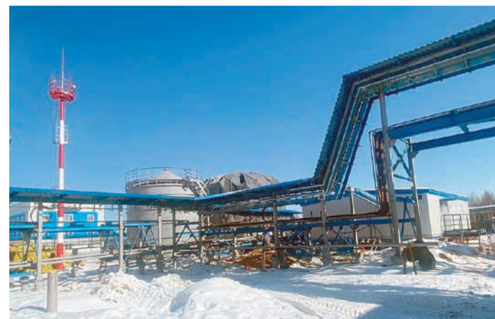
Посёлок Окунайский. Система хозяйственно-питьевого противопожарного водоснабжения