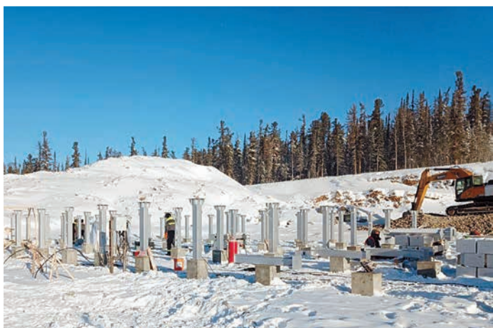
ПС 220 кВ / 110 кВ / 10 кВ «Ковыкта»

Комплекс КГКМ представляет собой самый современный объект газодобычи. Персоналу Иркутского филиала предстоит обслуживание большого числа энергообъектов КГКМ, в состав которых будут входить современные подстанции напряжением 220 кВ. Самым важным объектом энергетической инфраструктуры будет являться подстанция 220 кВ / 110 кВ / 10 кВ «Ковыкта», подача напряжения по которой запланирована на IV квартал 2023 года.