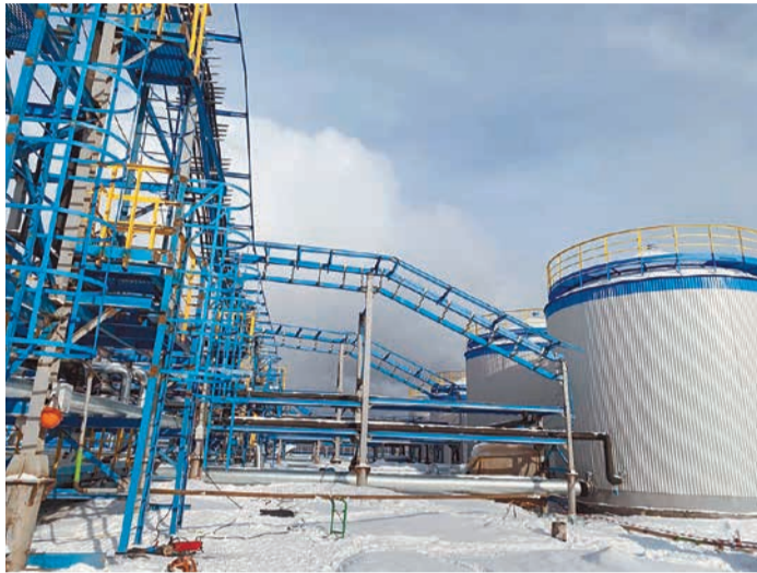
Нючакан. Система хозяйственно-питьевого и противопожарного водоснабжения

Иркутский филиал создан 7 октября 2022 г. и стал двенадцатым в дружной семье ООО «Газпром энерго». Деятельность филиала осуществляется в рамках управления производственными процессами энергетических объектов Ковыктинского газоконденсатного месторождения, а позднее – присоединение Чаяндинского нефтегазоконденсатного месторождения.