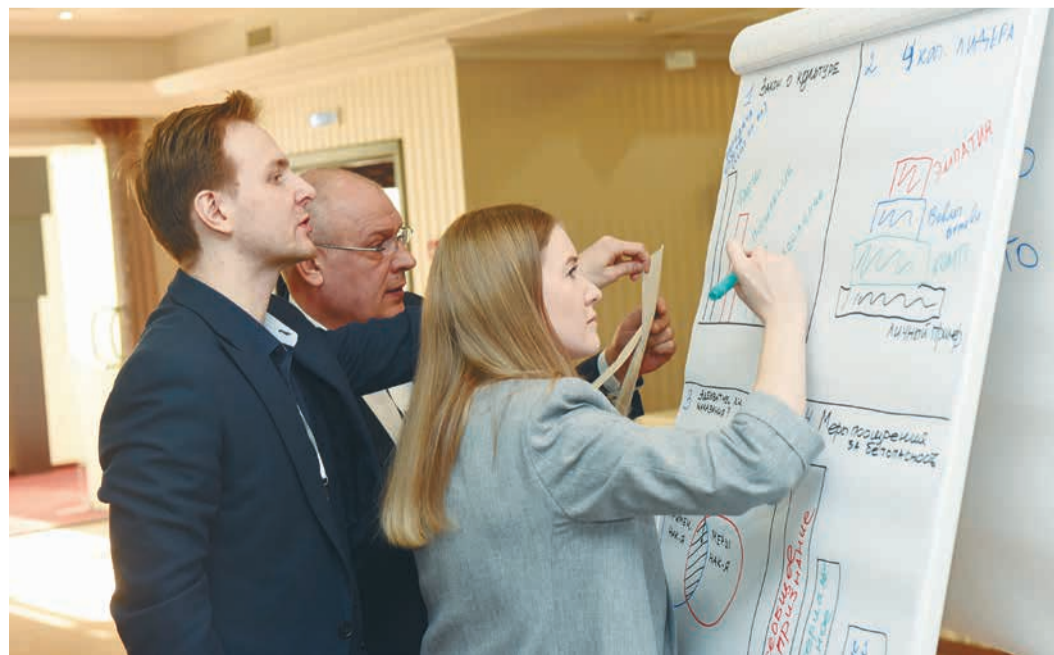
Обучение по культуре безопасности