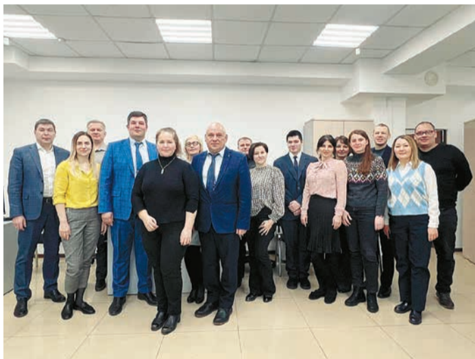
Коллектив Иркутского филиала ООО «Газпром энерго».

На 1 марта 2023 года численность Иркутского филиала составляет 69 человек, чуть менее половины из которых ранее являлись работниками других филиалов Общества. К концу 2023 года планируемая численность сотрудников составит около 380 человек, в том числе: Ковыктинское ГКМ – 155 человек, Чаяндинского НГКМ – 186 человек.