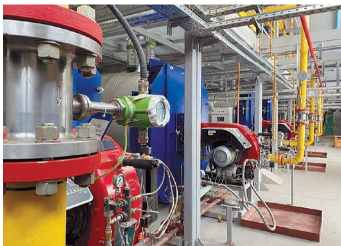
Котельная ПБ «Нючакан»

Одним из важнейших объектов жизнеобеспечения является промышленная база «Нючакан». Здесь при непосредственном участии персонала Иркутского филиала проходит активная фаза ввода в эксплуатацию. ПБ «Нючакан» представляет собой комплекс сооружений, несущих на себе задачи по обеспечению полноценного функционирования месторождения, это и организация проживания и досуга, обеспечение медицинской помощью сотрудников КГКМ, размещение складов МТР, стояночных боксов и ремонтных мастерских, систем водо- и теплоснабжения, подготовки топливного газа для котельных и многое другое.