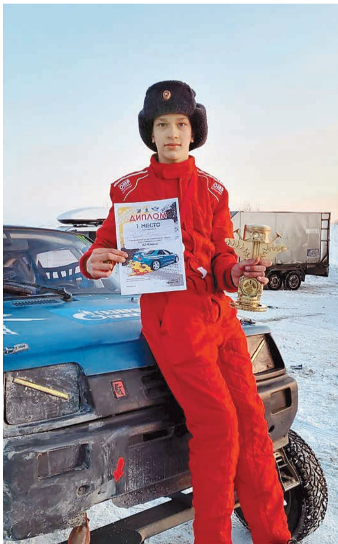
Победитель «Кросса первенство ЯНАО» в классе «Д2-Юниор» с заслуженным призом

«Так как в Надьме другое покрытие трассы, то я смотрел много видео про ледовый автокросс. Вникал, запоминал, в голове представлял все повороты и свои манёвры! Две недели до соревнований были очень сложными. Приходилось совме-