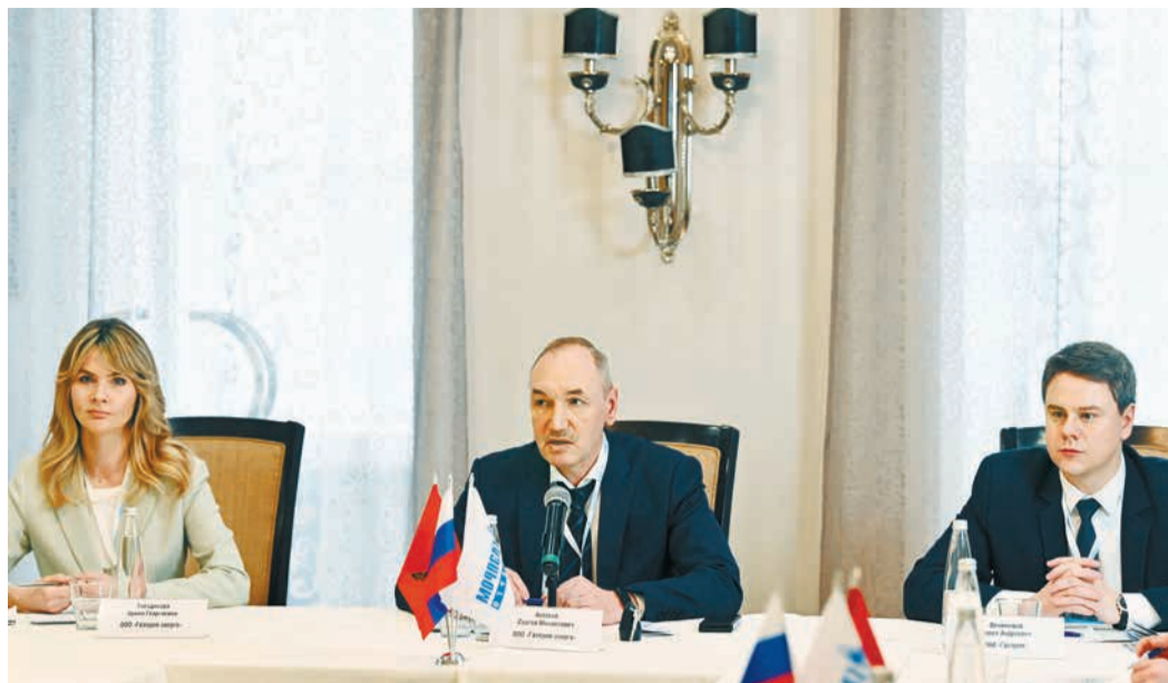
В зале заседаний