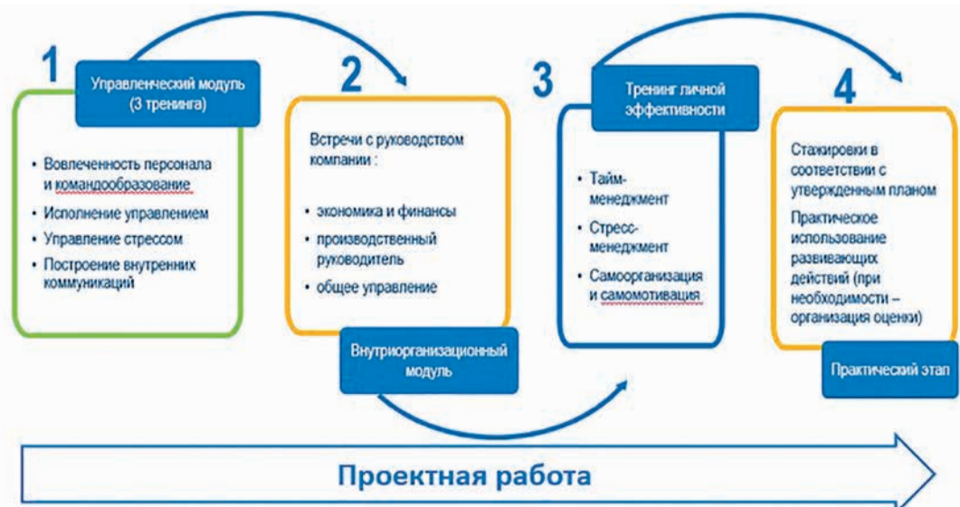
Схема обучения в Школе лидерства