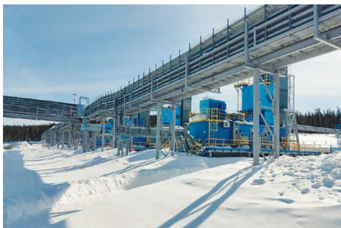
Электростанция собственных нужд

Важной задачей филиала является эксплуатация и сохранение работоспособности электростанции собственных нужд (ЭСН) общей мощностью 12,5 МВт, напряжением 10,5 кВ, обеспечивающей потребителей газового промысла надёжным энергоснабжением. УКПГ-3 планируется ввести в эксплуатацию в IV квартале 2023 года. В перспективе будет осуществлён ввод в эксплуатацию установок комплексной подготовки газа УКПГ-1 и УКПГ-45.