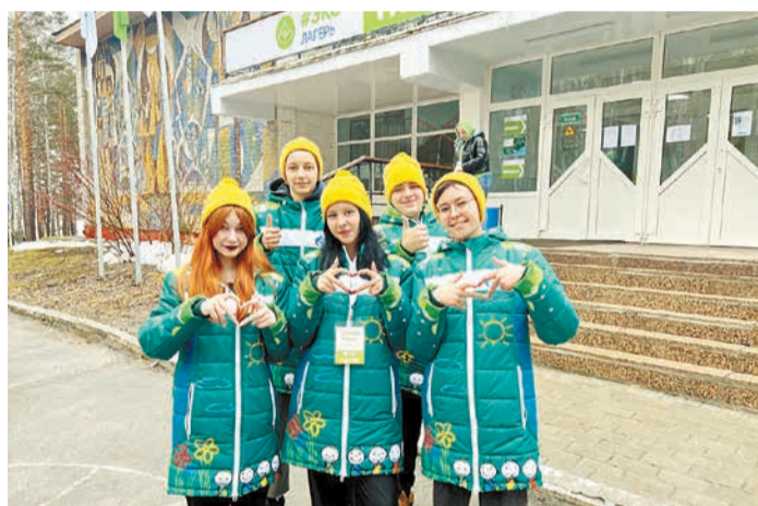
Делегация ООО «Газпром энерго»