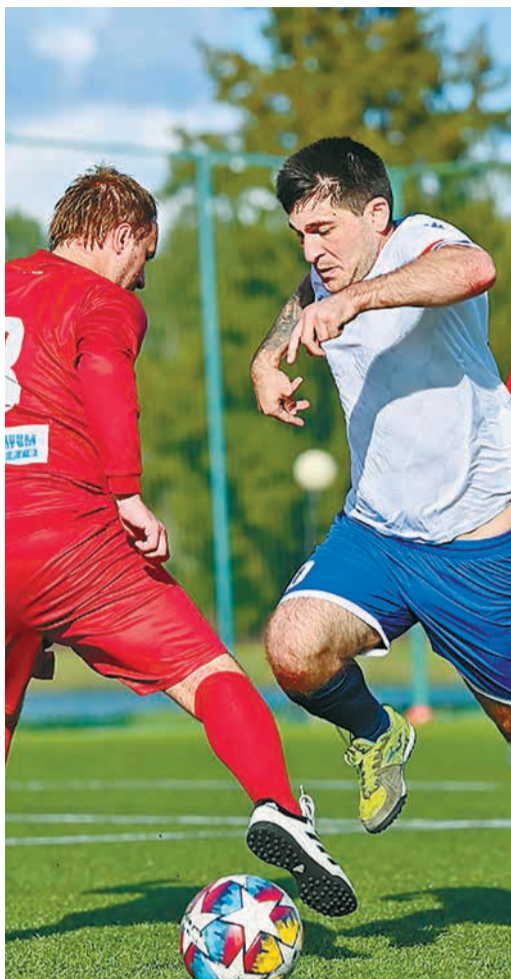
В футболе нет места паузам

«Я работаю в «Газпром энерго» чуть более трёх лет и никогда раньше не участвовал в корпоративной Спартакиаде. Несмотря на это, первый блин не был комом – стал победителем как в настольном теннисе, так и в дартсе. В теннисе был настроен на победу, так как занимаюсь им уже много лет – ещё со школы. Кроме наград, я увожу с собой самые замечательные впечатления. Хочу отметить работу организационного комитета – у нас были комфортные условия для тренировок и игр. Здесь превосходное состояние спортивных залов и футбольного поля. Осталось выявить сильнейших».