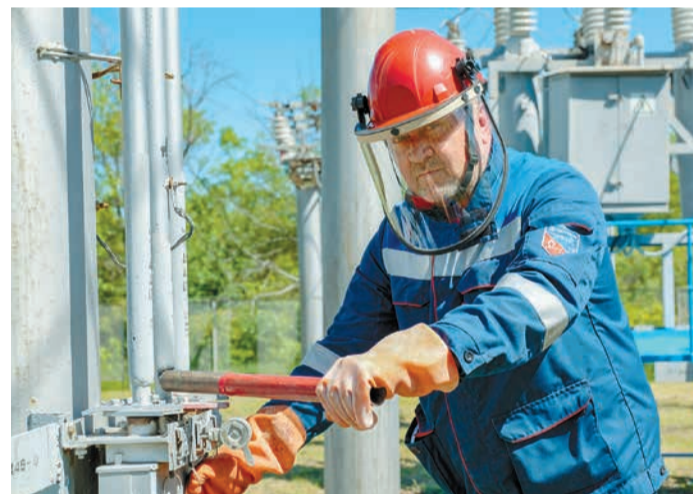
Электромонтер по ремонту и обслуживанию электрооборудования на подстанции «Рождественская»

Развитие Общества диктует непрерывные темпы роста и повышения эффективности. Сегодня здесь работают над увеличением состава эксплуатируемого оборудования, тщательно оценивают техническое состояние и экономическую эффективность принимаемых на баланс энергетических объектов. В рамках реализации комплексных целевых программ реконструкции и технического перевооружения объектов энергетики ПАО «Газпром», находящихся в эксплуатации ООО «Газпром энерго», проводится реконструкция объектов