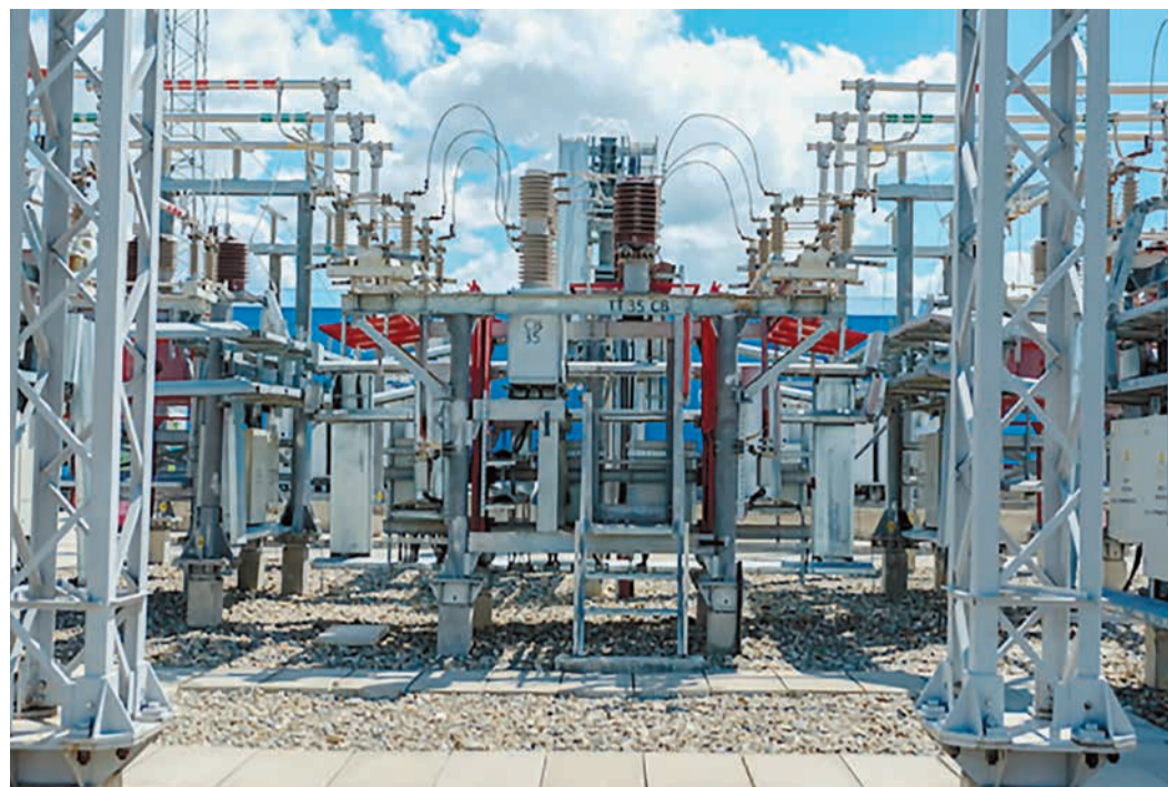
Подстанция «Компрессорная», Майкоп, Республика Адыгея

внешнего электроснабжения компрессорной станции (КС) «Егорлыкская», в 2024 году планируется реконструировать ПС 35/10 кВ КС «Рождественская».