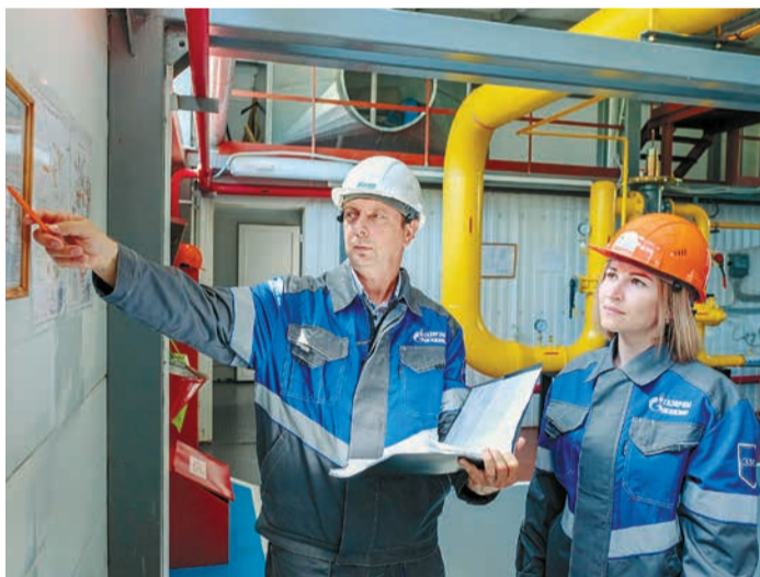
Ознакомление со схемой тепловых сетей котельной № 1 в посёлке Рыздвяном

Северо-Кавказский филиал ООО «Газпром энерго» ведет свою историю с августа 2005 года. Первое время его силами обслуживалось всего 72 объекта внешнего энергоснабжения. Филиал стремительно вырос, обрел необходимую производственную базу и сегодня обслуживает около 180 объектов, посредством которых осуществляется обеспечение энергетическими ресурсами дочерних обществ Группы «Газпром»: