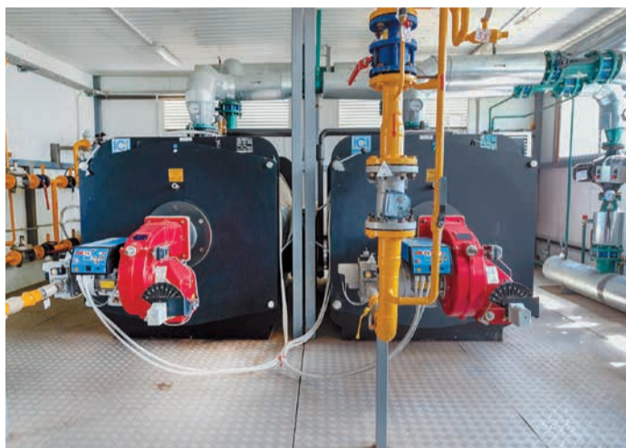
Оборудование котельной в станции Каневской, Краснодарский край

Задачей Северо-Кавказского филиала также является обеспечение надёжного и эффективного энергоснабжения потребителей, объектов социального назначения. Энерго-, тепло-, водоснабжение осуществляются бесперебойно, а возникающие нештатные ситуации устраняются быстро. Кроме того, филиал оказывает содействие Рыздвяненскому территориальному управлению администрации Изобильненского городского округа Ставропольского края поддерживать в рабочем состоянии объекты коммунальной инфраструктуры (электрические и тепловые сети, сети водоснабжения и водоотведения), признанные бесхозными.