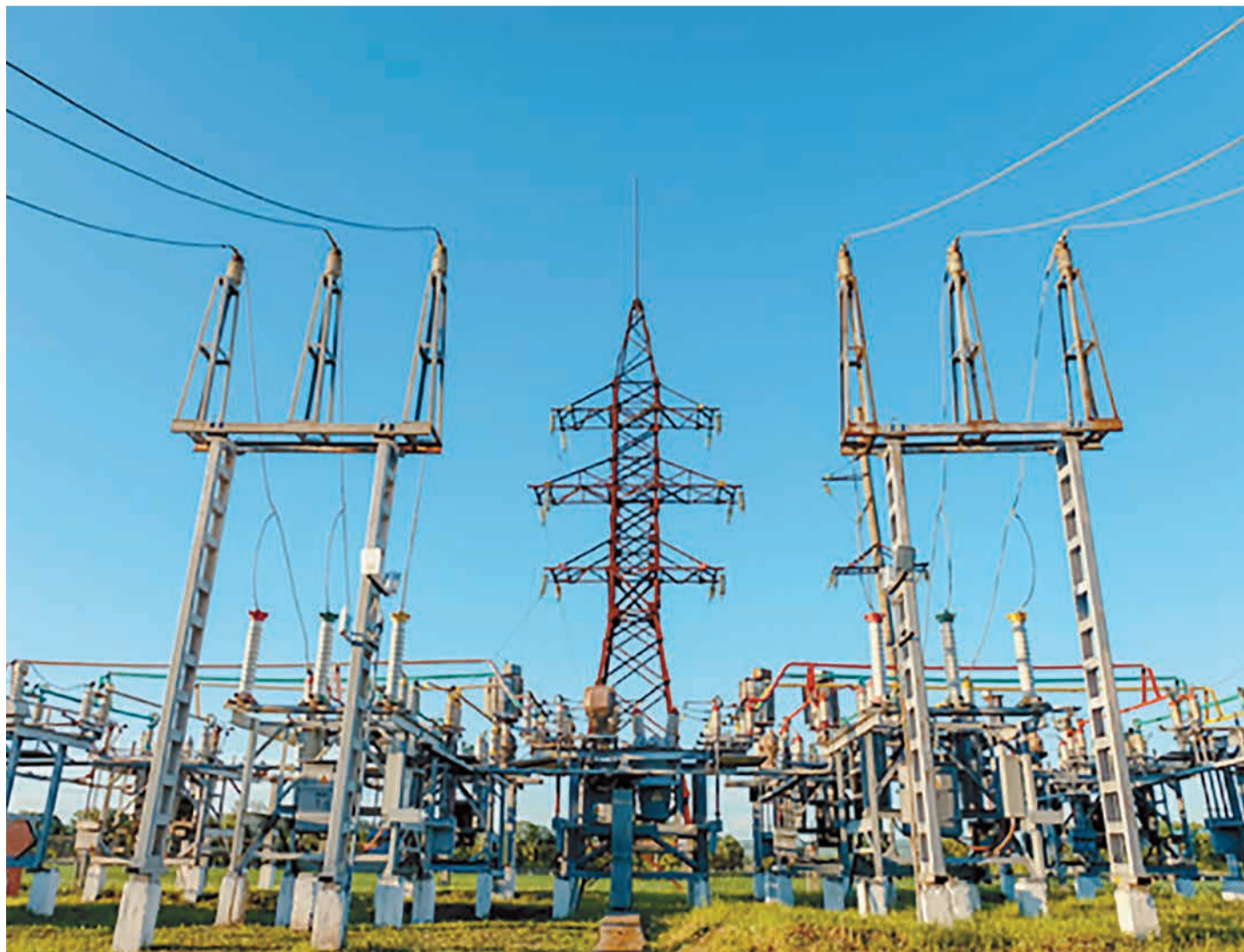
Подстанция «Газовая», Успенский район, Краснодарский край

Растительный орнамент занимает главное место в казачьей вышивке. Схематические изображения деревьев и цветов в самых разнообразных комбинациях вышивали на одежде, скатертях, рушниках. Излюбленными были мотивы розы, считалось, что она выполняет роль оберега. Цвет в орнаменте тоже символичен. В основном мастерицы использовали красный – символ солнца, огня, крови – и черный – цвет земли, пашни, ночи, покоя.