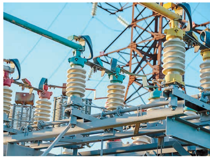
Подстанция «Газовая», Успенский район, Краснодарский край

На постоянной основе проводится работа по согласованию и реализации инвестиционных программ по капитальному ремонту и модернизации эксплуатируемых энергетических объектов, что позволяет не только планомерно повышать