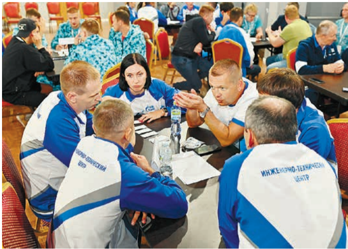
Бронзовые призеры третьего этапа «Своей игры»

После подведения итогов победители в личном первенстве были награждены бронзовыми, серебряными и золотыми медалями, а команды – медалями и кубками за призовые места в командных первенствах.