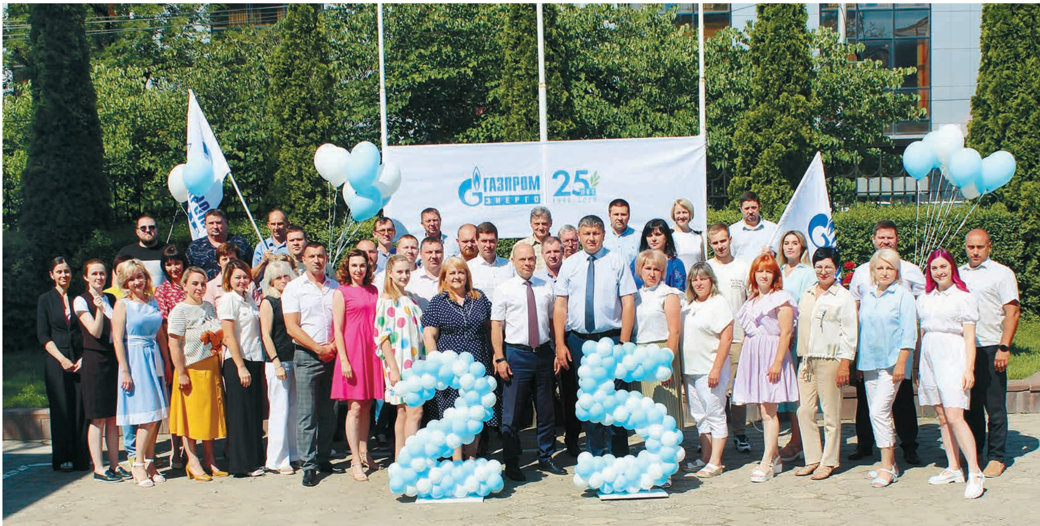
Работники Северо-Кавказского филиала