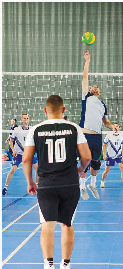
Волейбол – это спорт, где смотрят только вверх!

«Я принимаю участие в Спартакиаде впервые, и мероприятие превзошло все мои ожидания. Я очень рад, что нахожусь в дружной команде «Газпром энерго». Пребывание здесь дало мне возможность проявить себя, пообщаться с коллегами из разных уголков нашей страны, узнать и открыть для себя много нового, испытать море эмоций и получить бесценный опыт».