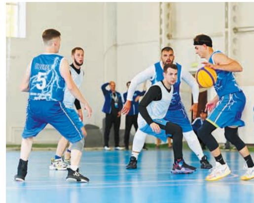
Рыжий центр притяжения

«Мы много готовились к поездке. Проводили тренировки по два раза в неделю, футболисты из нашей команды ещё чаще играли. Мы ехали за победой. Наш капитан как локомотив – ведёт нас только вперёд. Волейболом я занимаюсь со школы, имею второй взрослый разряд. Хотел бы, чтобы учли на следующей Спартакиаде необходимость увеличения количества спортсменов в командах. Сейчас многим приходится участвовать в нескольких видах спорта, а это слишком большие нагрузки».