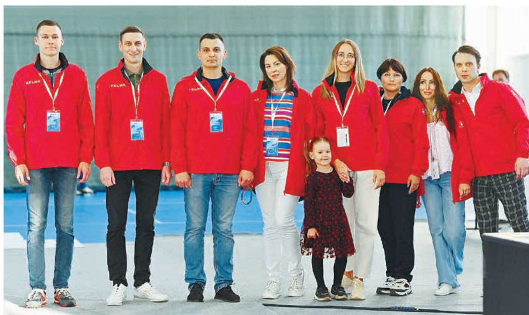
Команда, готовых всегда помочь

Красные ветровки, бейдж на груди и огромное желание помогать людям. Внести личный вклад в мероприятие и получить яркие эмоции – вот главная мотивация для десяти сотрудников Администрации, работавших на Спартакиаде волонтерами.