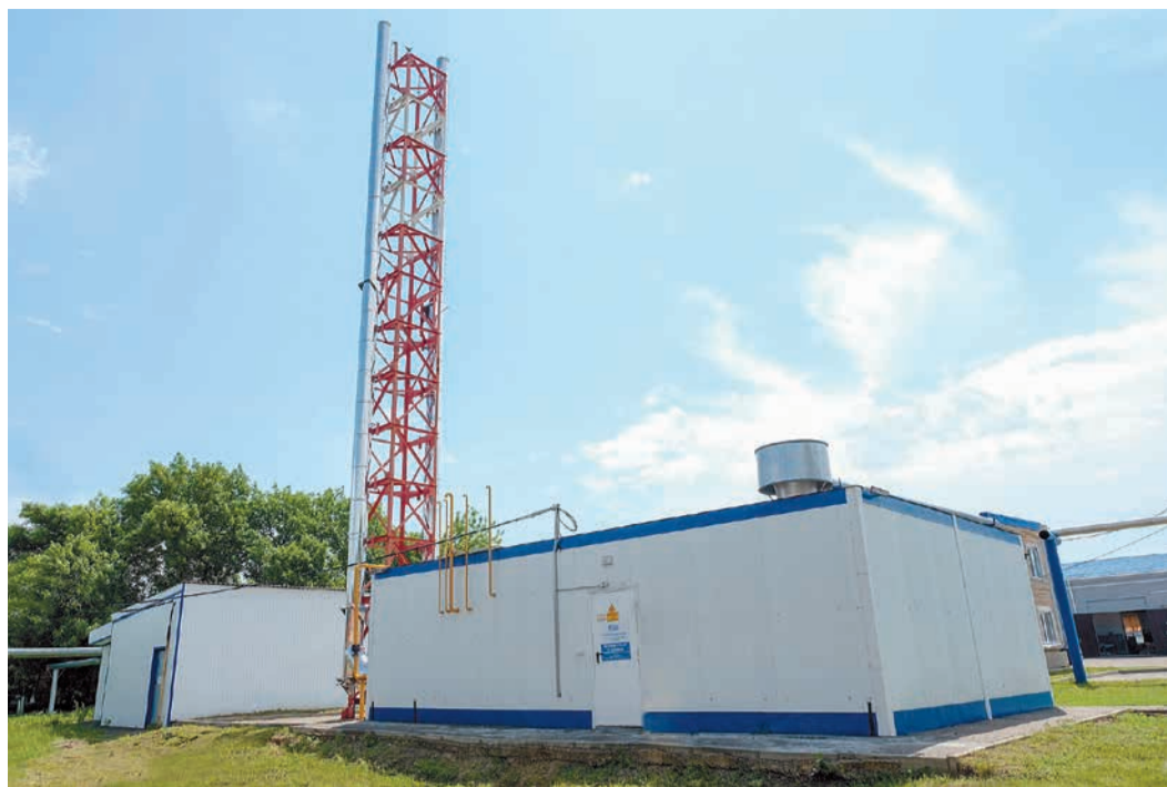
Котельная в станции Каневской, Краснодарский край