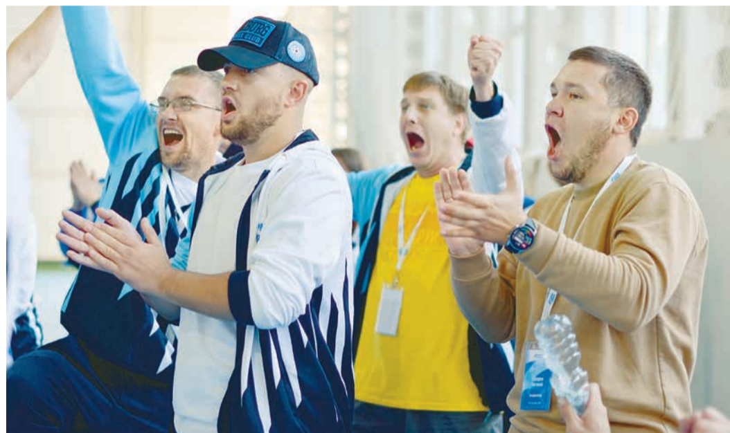
Эмоции болельщиков на пределе