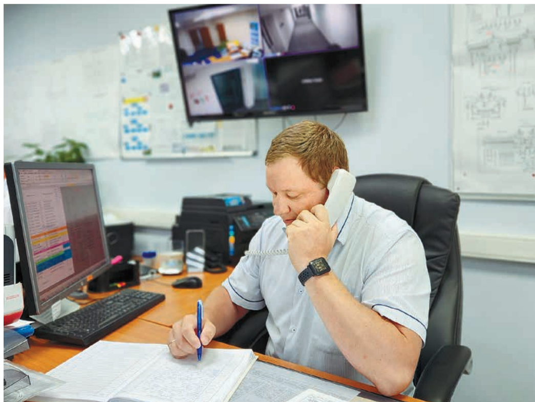
Диспетчер за работой