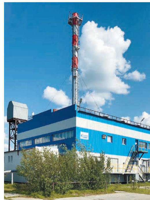
Котельная № 2

В работе энергетиков важен каждый нюанс. А уж в вопросах безопасности мелочей не бывает. На объектах «Газпром энерго» им уделяется особое внимание. Чтобы обеспечить безопасность и бесперебойную работу, в Котельной № 2, которая обслуживается Заполярым управлением энерговодоснабжения Уренгойского филиала, сделали капитальный ремонт.