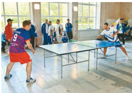
Стремление к победе