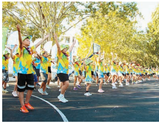
В санатории в Анапе отдохнули более 200 детей сотрудников ООО «Газпром энерго»