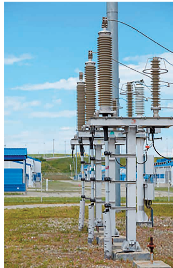
Подстанция «Русская», Анапа, Краснодарский край