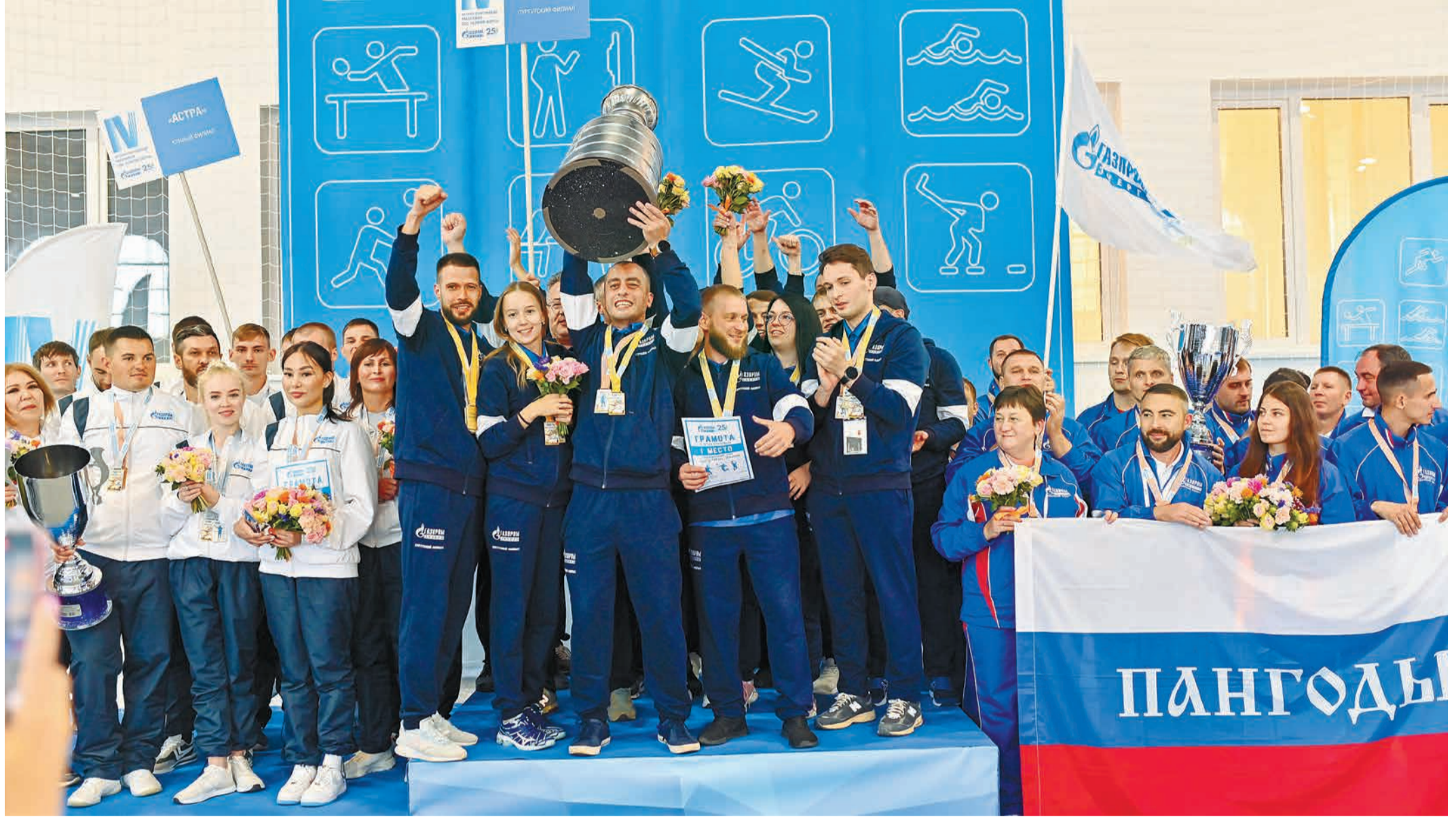
Упорство и сплоченность помогли командам завоевать кубки победителей.

С 5 по 7 сентября в Подмоскovie проходила IV Летняя Спартакиада ООО «Газпром энерго», посвященная 25-летию компании. Участие в соревнованиях приняли более 200 работников из двенадцати структурных подразделений и Администрации Общества. Главными целями проведения спортивного праздника стали популяризация здорового образа жизни, пропаганда физической культуры и спорта, повышение интереса сотрудников к участию в спортивных мероприятиях и сохранение спортивных традиций.