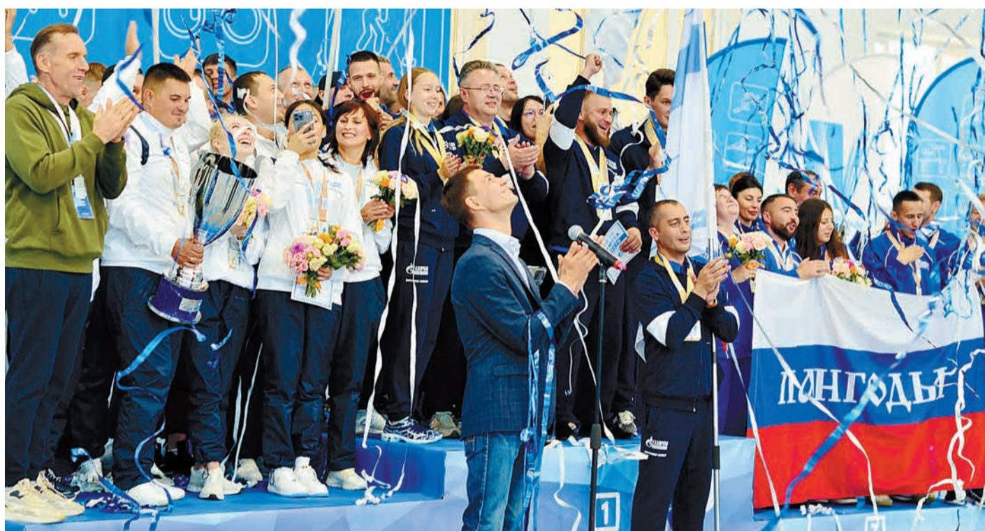
Спартакиада объявляется закрытой!